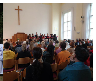
中德教会主日联合礼拜