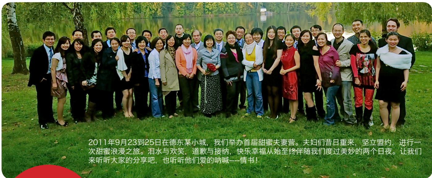
2011年9月23到25日在德东某小城，我们举办首届甜蜜夫妻营。夫妇们昔日重来，坚立盟约，进行一次甜蜜浪漫之旅。泪水与欢笑，道歉与接纳，快乐幸福从始至终伴随我们度过美妙的两个日夜。让我们来听听大家的分享吧，也听听他们爱的呐喊——情书！